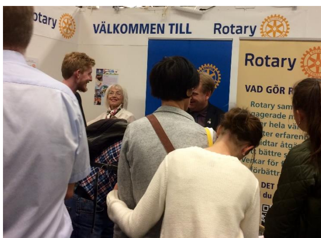
Stundtals var trycket i montern stort. På ren Göteborgska, var det helt enkelt knökfullt!