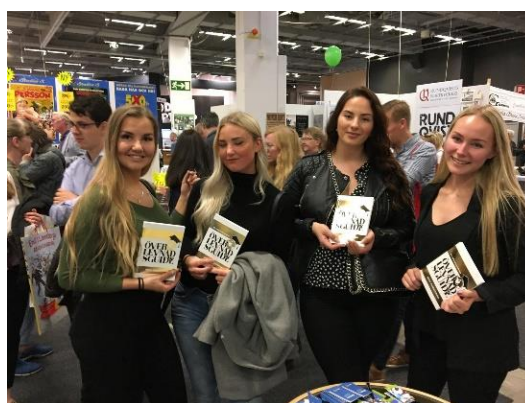
Flera intresserade ungdomar fick ett exemplar av "Överlevnadsguide för utbytesstudenter"