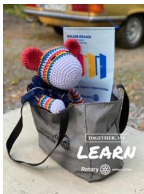
Rut på väg till klubbesök