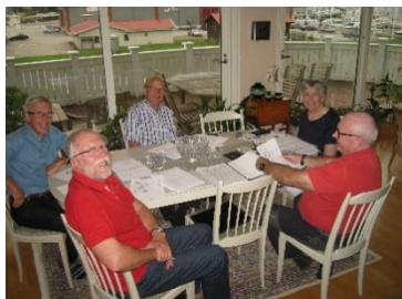
Planeringsgruppen från Orust RK

Styrelsen framför ett varmt tack till Orust Rotaryklubb som med så stort engagemang har ansvarat för ekonomihantering och allt det praktiska vid olika arrangemang under verksamhetsåret t.ex. PrePETS, PETS, guvernörsskifte, årsmöte, seminarier, distriktskonferens och Rotarygolven.